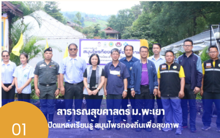
สาธารณสุขศาสตร์ ม.พะเยา เปิดแหล่งเรียนรู้ สมุนไพรท้องถิ่นเพื่อสุขภาพ