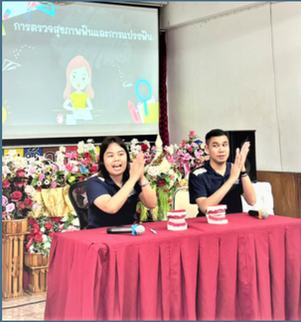
สาขาวิชาอนามัยชุมชน

สาขาวิชาอนามัย ชุมชน มพ. จัดกิจกรรม บริการวิชาการสู่ชุมชน ส่งเสริมองค์ความรู้ด้าน อนามัยโรงเรียน