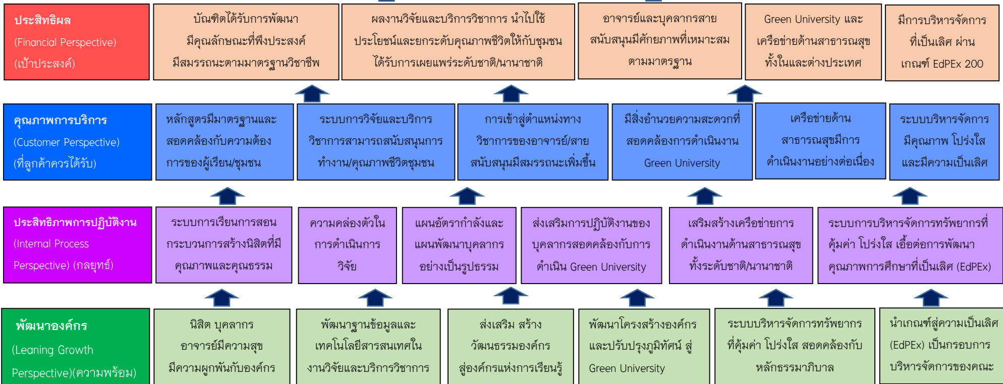
แผนภาพที่ 2 แสดงแผนที่ทางเดินยุทธศาสตร์ (Strategy Map) คณะสาธารณสุขศาสตร์ มหาวิทยาลัยพะเยา พ.ศ. 2564-2568